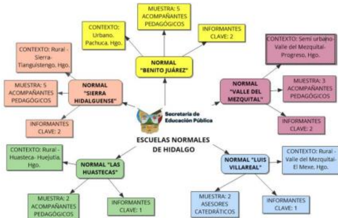
Fig. 2. Muestreo estratificado de las Escuelas Normales del Estado de Hidalgo. Realizado por Martha Edith Juárez, Rojas. 2023.

Con base a lo anteriormente expuesto, se han realizado entrevistas semiestructuradas a profundidad a los acompañantes pedagógicos de las Escuelas Normales y a los informantes clave de las instituciones, así como la realización de sesiones de grupos focales integrados por estudiantes normalistas de las distintas licenciaturas en educación que se ofertan.