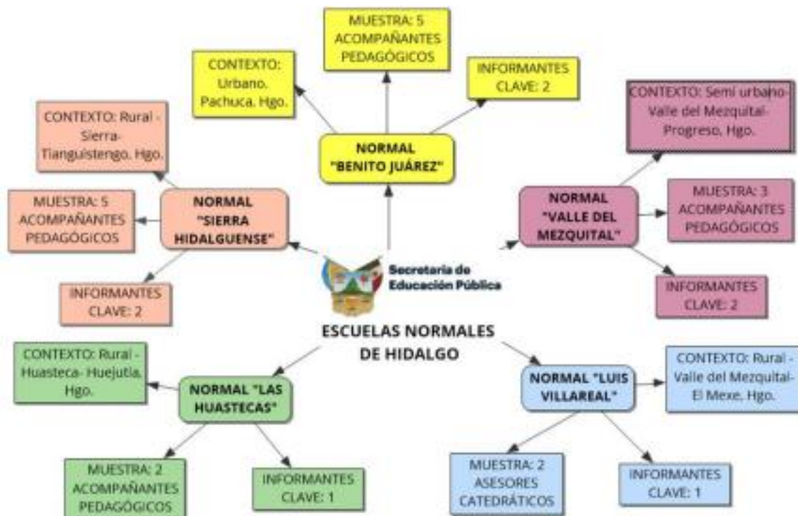
Fig. 2. Muestreo estratificado de las Escuelas Normales del Estado de Hidalgo. Realizado por Martha Edith Juárez, Rojas. 2023.

Con base a lo anteriormente expuesto, se han realizado entrevistas semiestructuradas a profundidad a los acompañantes pedagógicos de las Escuelas Normales y a los informantes clave de las instituciones, así como la realización de sesiones de grupos focales integrados por estudiantes normalistas de las distintas licenciaturas en educación que se ofertan.